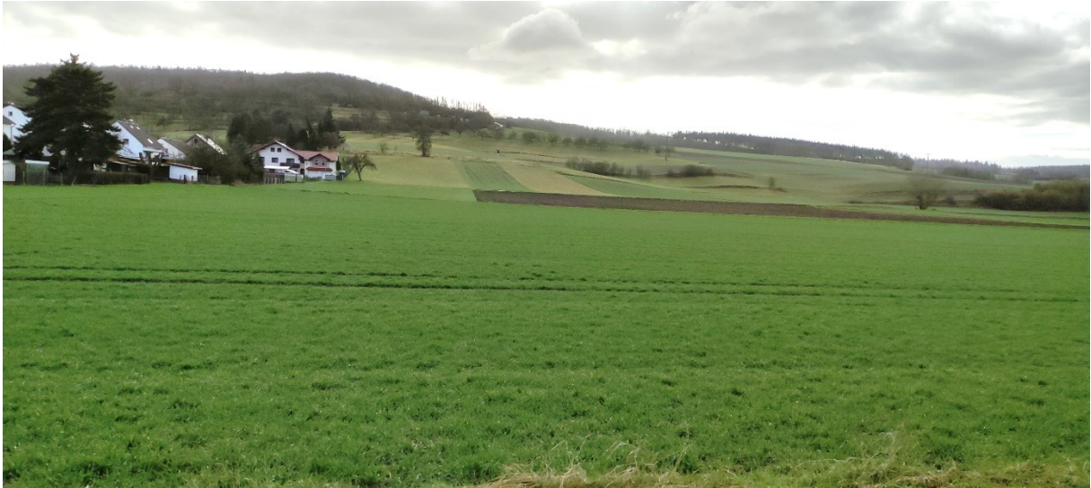
Abbildung 3) Ackerflächen im Geltungsbereich

Im Umfeld außerhalb des Geltungsbereiches befinden sich weitere Ackerflächen sowie Richtung Süden eine Frischwiese mäßig intensiver Nutzung (06.340). Zum Zeitpunkt der Begehung, konnten dort folgende Pflanzenarten nachgewiesen werden: Weiß-Klee ( Trifolium montanum ), Spitz-Wegerich ( Plantago lanceolata ), Löwenzahn ( Taraxacum Sect. Borealia ), Gemeine Schafgarbe ( Achillea millefolium ), Kleine Braunelle ( Prunella vulgaris ), Kriechender Hahnenfuß ( Ranunculus repens. ), Kleiner Sauer-Ampfer ( Rumex acetosella ), Wicke ( Vicia spec. ), Wilde Möhre ( Daucus carota ), Wiesenflockenblume ( Centaurea jacea ), Wiesen-Labkraut ( Galium mollugo ), Gemeines Hornkraut ( Cerastium fontanum ), Goldhafer ( Trisetum flavescens ), Knautgras ( Dactylis glomerata ), Wiesenschwingel ( Festuca pratensis ). Auf der Fläche befindet sich zudem ein Apfelbaum ( Malus domestica ; 04.110).