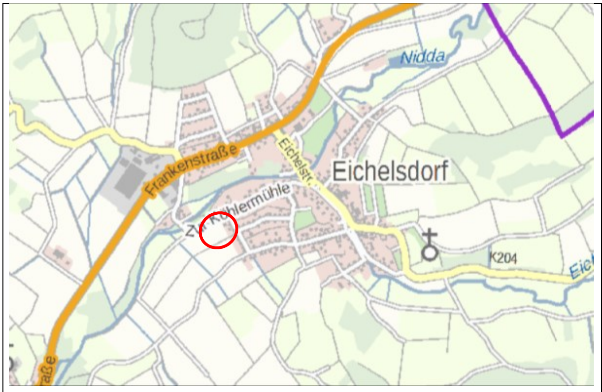
Abbildung 1) Lage des Planungsgebietes (rot)