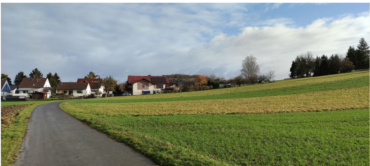
Abbildung 4) Grünlandflächen und Asphaltweg südlich, außerhalb des Planungsgebietes

Neben einem asphaltierten Feldweg (10.510) befindet sich ein bewachsener, unbefestigter Feldweg (10.610) im Planungsgebiet.