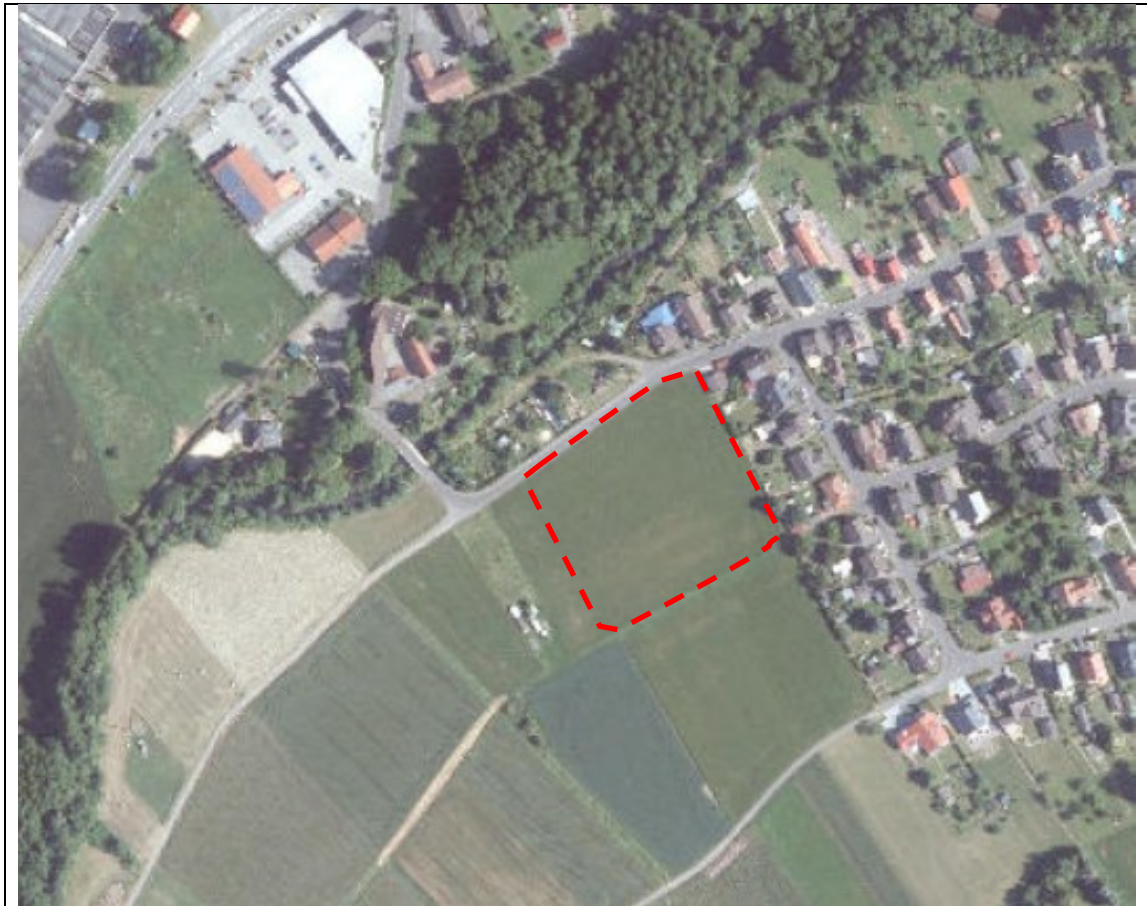
Abbildung 2) Biotopstruktur im Planungsgebietes (rot) und Umfeld