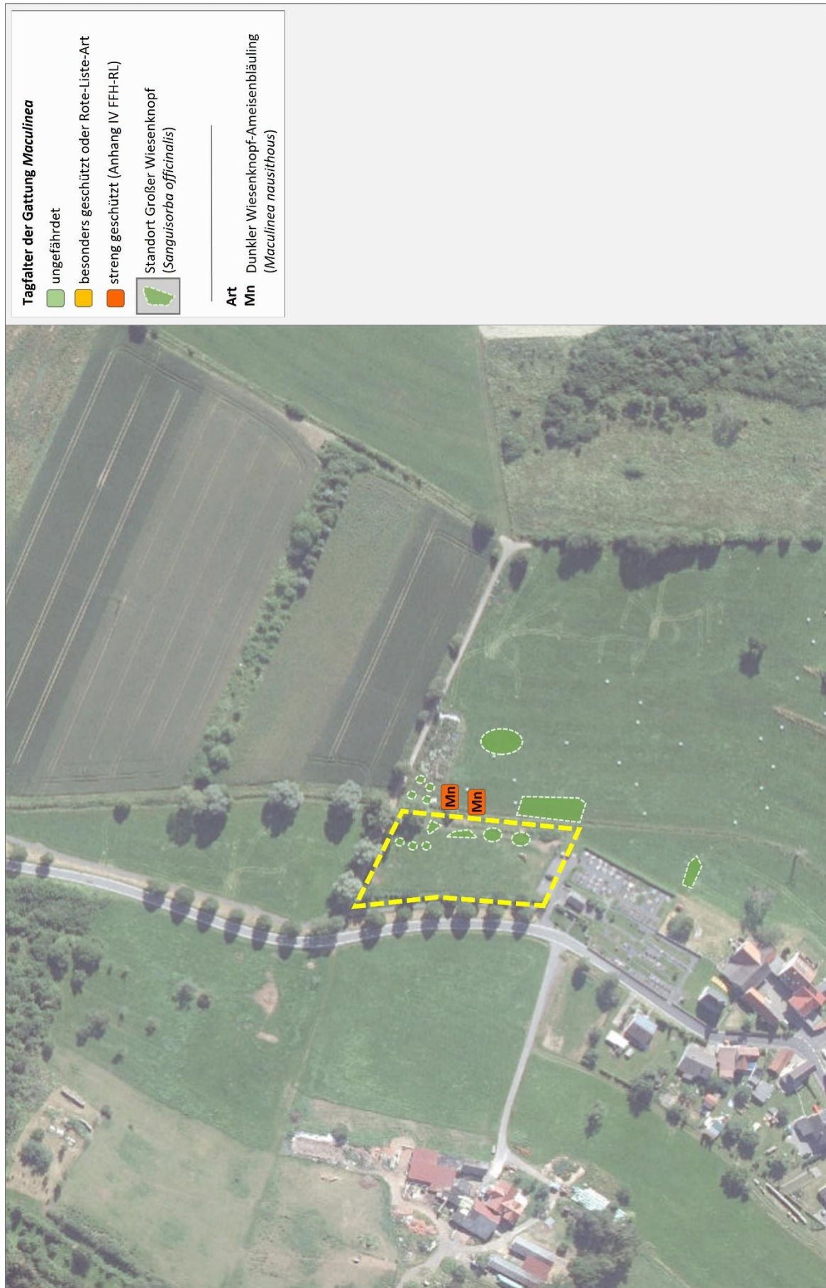
Abb. 4: Maculinea im Untersuchungsraum 2023 (Bildquelle: Hess. Ministerium für Umwelt, Klimaschutz, Landwirtschaft und Verbraucherschutz, aus natureg.hessen.de, 09/2023).