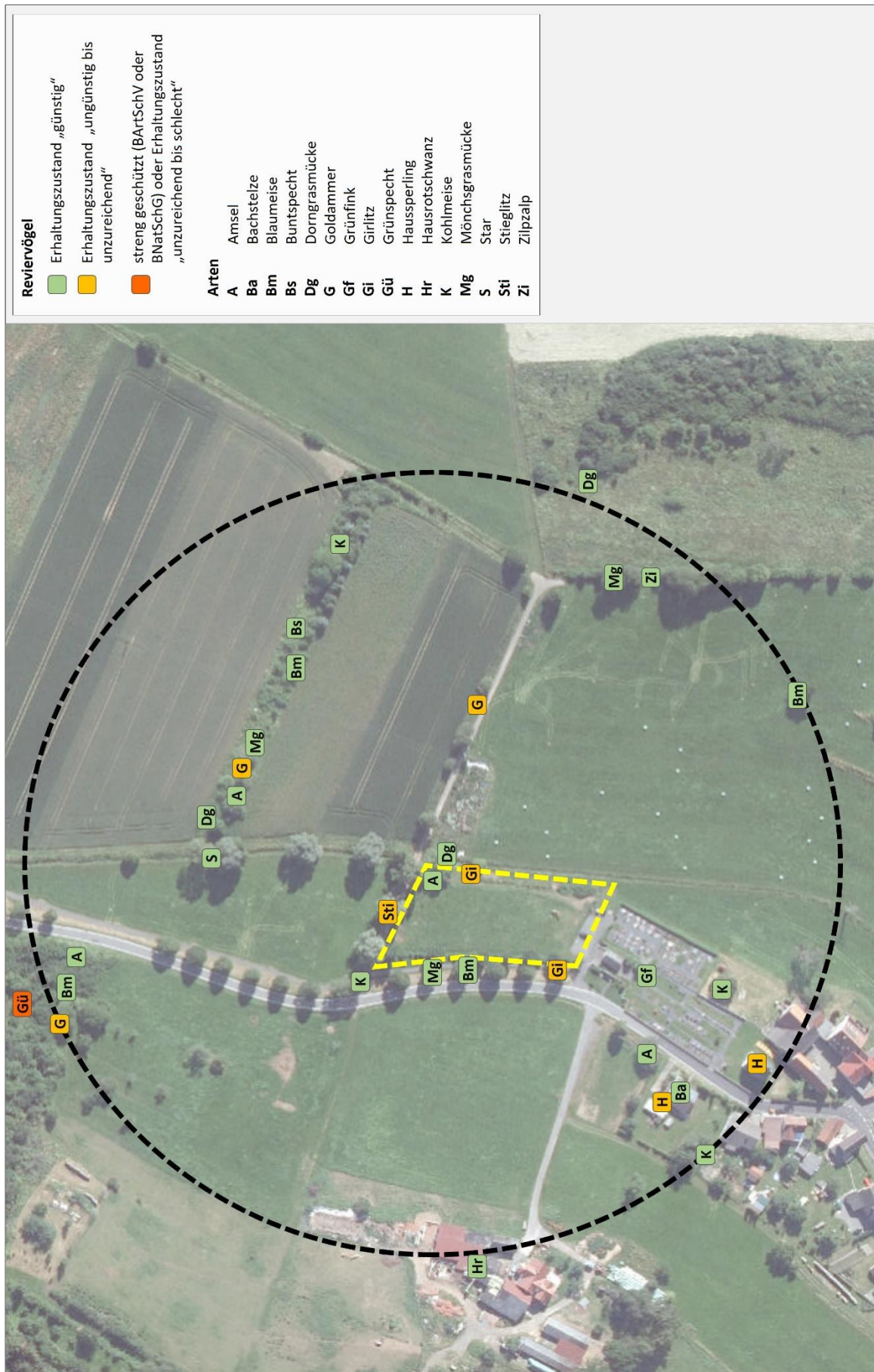
Abb. 2: Reviervogelarten im Untersuchungsraum 2023.